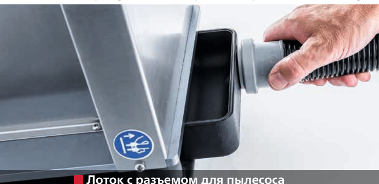
■ Лоток с разъемом для пылесоса

Образующаяся при полировании пыль удаляется пылесосом