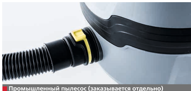
■ Промышленный пылесос (заказывается отдельно)

Помимо системы охлаждения водой станок EVO 5 по желанию заказчика может быть оснащен устройством вытяжки полировальной пыли.