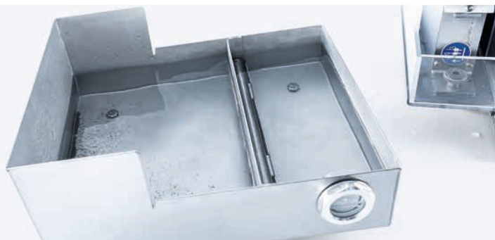
Поддон для воды