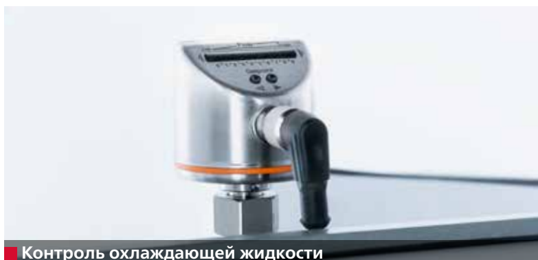
■ Контроль охлаждающей жидкости

Станок USK 230 В - HV 208 II исключительно прост в управлении. Наиболее важные параметры, такие как количество циклов заточки и контур ножей, оператор задает непосредственно на сенсорной панели станка. Таким образом, после каждой последующей заточки профиль режущего инструмента точно соответствует изделию, для которого он предназначен.