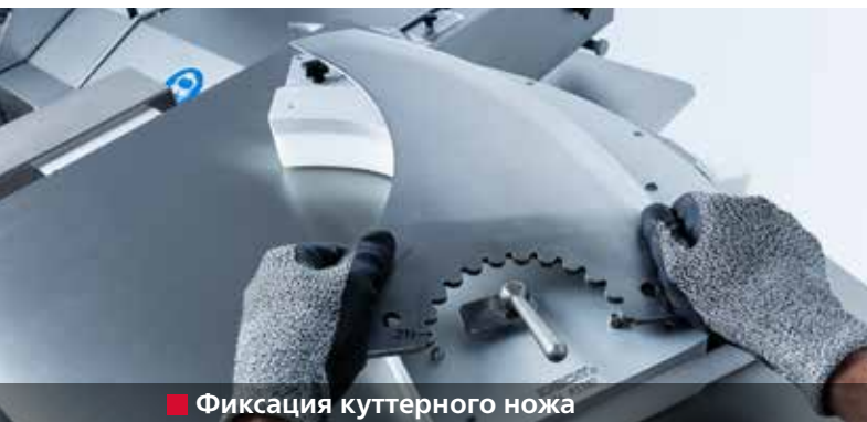
■ Фиксация куттерного ножа

Заточка куттерных ножей точно по форме в полностью автоматическом режиме