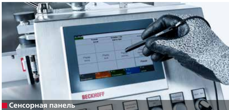
■ Сенсорная панель

Станок USK 230 В - HV 208 II затачивает до 100 куттерных ножей (500 л) за смену в полностью автоматическом режиме. Среднее время заточки и полирования одного ножа составляет 2–3 минуты, в зависимости от размера ножа.