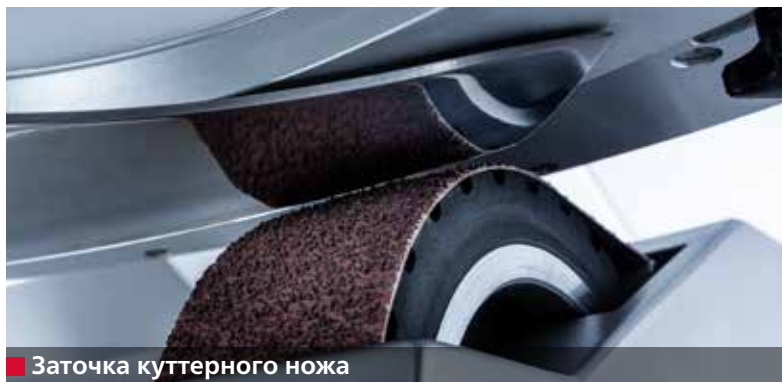
■ Заточка куттерного ножа

Острота, угол режущей кромки, форма и профиль куттерного ножа имеют большое влияние на качество производимой продукции.