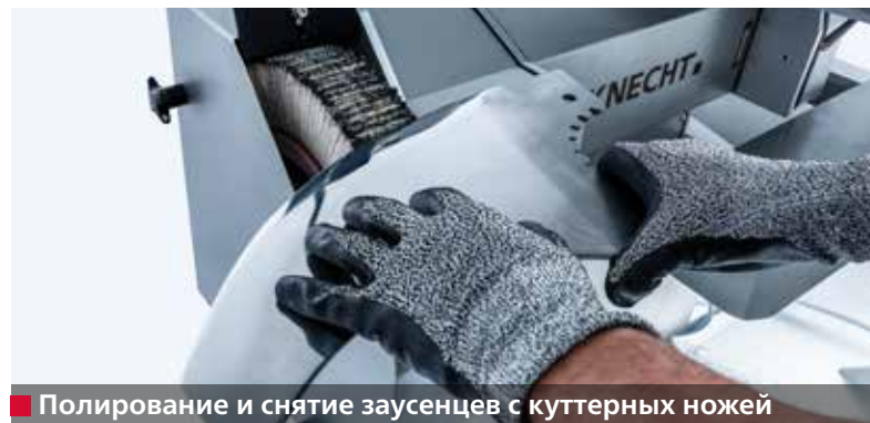
■ Полирование и снятие заусенцев с куттерных ножей

Технология щадящей заточки и простое управление