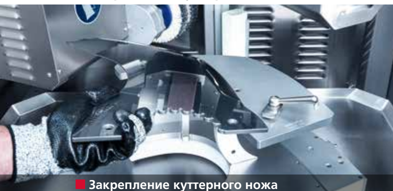
■ Закрепление куттерного ножа

Шлифование куттерных ножей в полностью автоматическом режиме