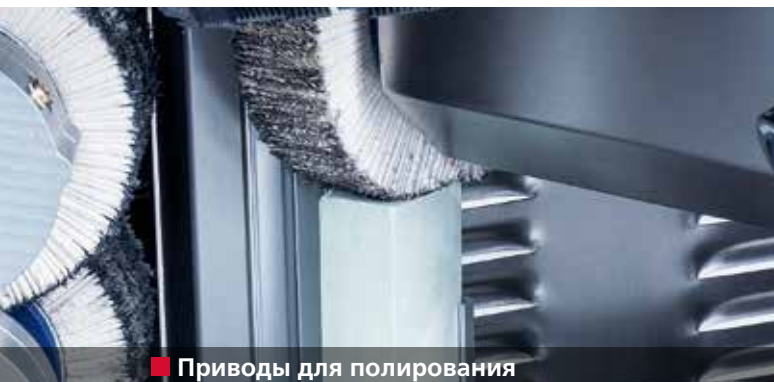
■ Приводы для полирования

Последующая заточка точно по форме. Исключительно простое управление.