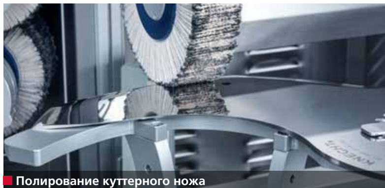
■ Полирование куттерного ножа

Полирование и снятие заусенцев с куттерных ножей в полностью автоматическом режиме