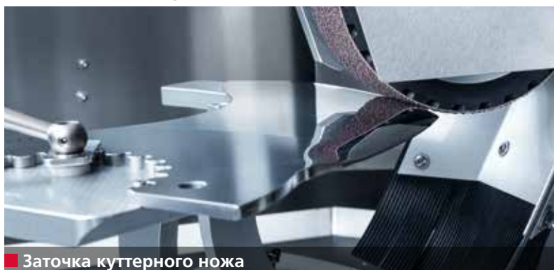
■ Заточка куттерного ножа

Острота, угол режущей кромки, форма и профиль куттерного ножа имеют большое влияние на качество производимой продукции.