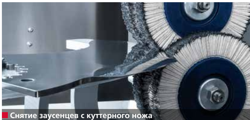
■ Снятие заусенцев с куттерного ножа

Станок В 500 затачивает, снимает заусенцы и полирует в полностью автоматическом режиме до 100 куттерных ножей (500 л) за 8-часовую смену. Среднее время заточки и полирования одного ножа составляет от 3 до 5 минут в зависимости от размера ножа.