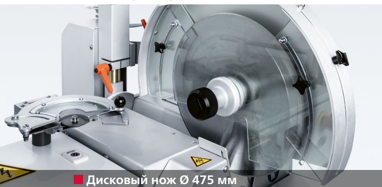
■ Дисковый нож Ø 475 мм

благодаря бережно заточенным дисковым ножам