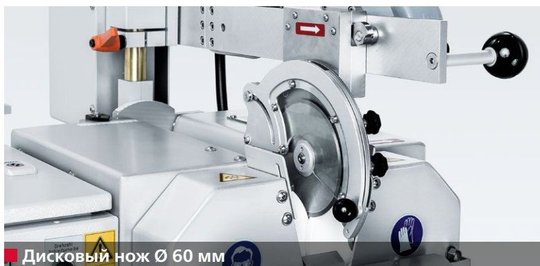
■ Дисковый нож Ø 60 мм

Острота, угол режущей кромки и ширина фаски дискового ножа имеют большое влияние на качество разрезаемой продукции.