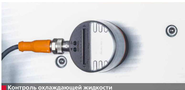
■ Контроль охлаждающей жидкости

Вытяжное устройство серийного производства и система охлаждения водой значительно уменьшают все выбросы, которые возникают в процессе заточки и полирования. Органы дыхания оператора защищены.