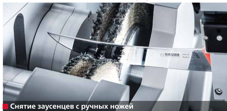
■ Снятие заусенцев с ручных ножей

Высокоточные срезы улучшают качество продукции