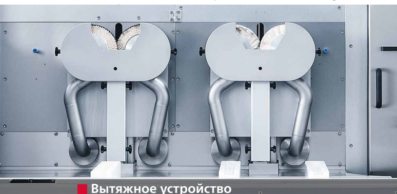
■ Вытяжное устройство

Заклученный в герметичный кожух станок с вытяжкой и охлаждением водой