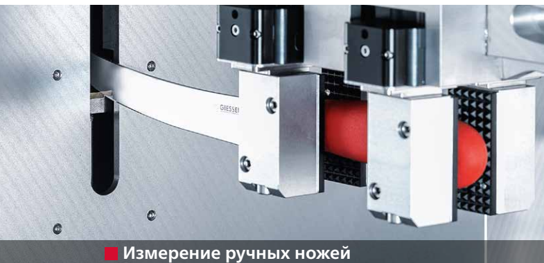
■ Измерение ручных ножей

Станок с ЧПУ позволяет получить безупречно заточенные ручные ножи