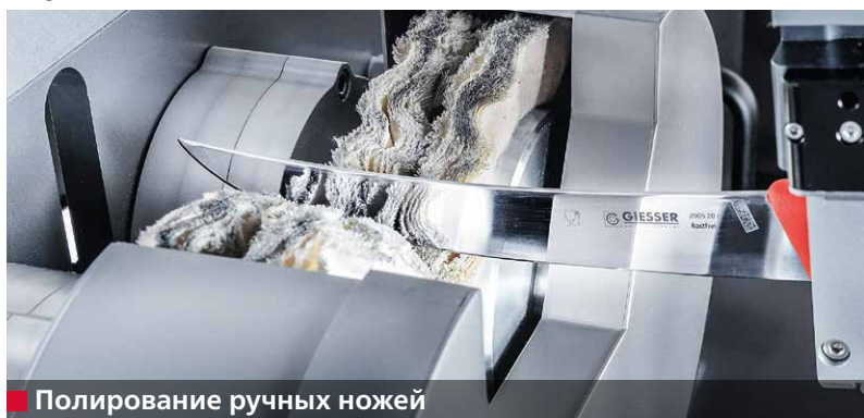
■ Полирование ручных ножей

Станок E 50 автоматически затачивает ручные ножи различной формы и размеров. Зажимное приспособление для захвата ножа извлекает нож из накопителя. После этого выполняется оптическое измерение формы ножа. Затем нож затачивается, зачищается и полируется. Захват ножа возвращает окончательно обработанный нож назад в накопитель.