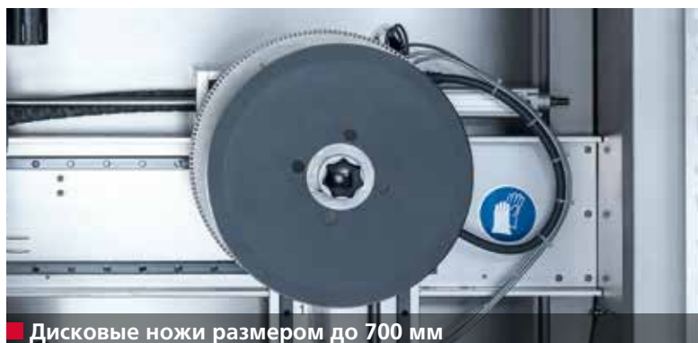
■ Дисковые ножи размером до 700 мм

Станок А950 III предназначен для односторонней и двусторонней заточки дисковых ножей диаметром от 300 до 700 мм любых марок.