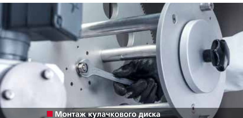
■ Монтаж кулачкового диска

Заточка ножей слайсеров в полностью автоматическом режиме