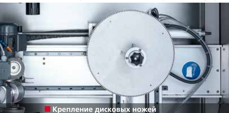
■ Крепление дисковых ножей

благодаря максимальной простоте в управлении