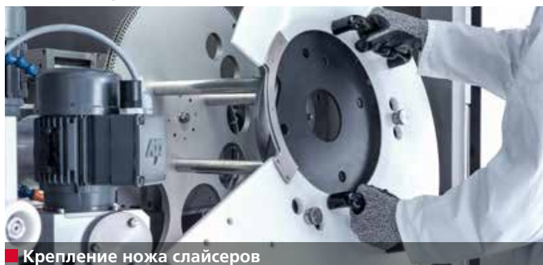
■ Крепление ножа слайсеров

Безупречное качество резки, поверхность без свилей и точно укладываемая продукция. Станок А 950 III обеспечивает высокоточную заточку ножей слайсеров, которые удовлетворяют этим требованиям.