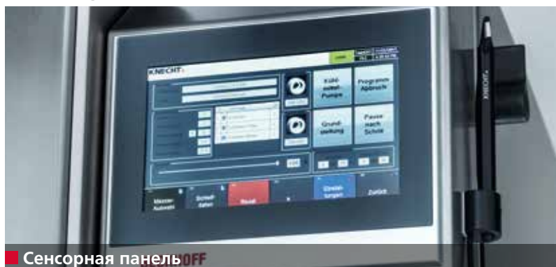
■ Сенсорная панель OFF